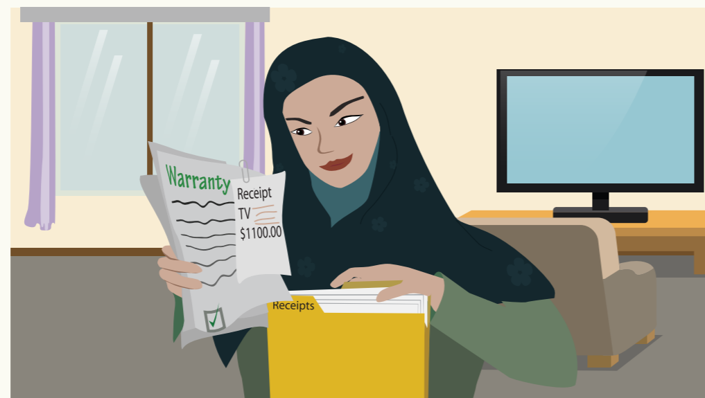
Ye awēreŋ ē raan cī kēŋ yōoc ku warranty tōō tē puoth. Kek aye yōny dun ē kēŋ nyuōth na noŋ kē lo wāac