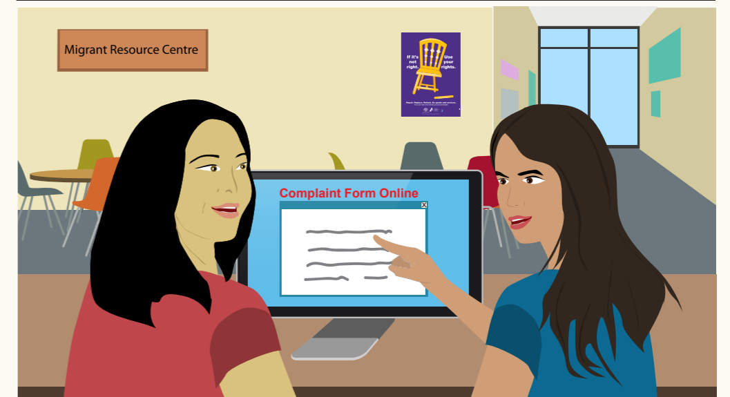
Na nõñ yin kë dhal yin kekë matacjr, yin alëu ba dhulum cuat onlany, në tooc de meil, yup ka loor në mëktëm de Consumer Protection Agency thiök në State ka Territory du yic.