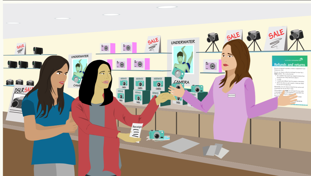
Dun ë nhom mër ba awërenj dun cïn këñ yöoc yäth na thiéc matacjr bi këñ dhuk ë juiëer, waar/geer ku dhuk wëu cinë ke këñ yöoc