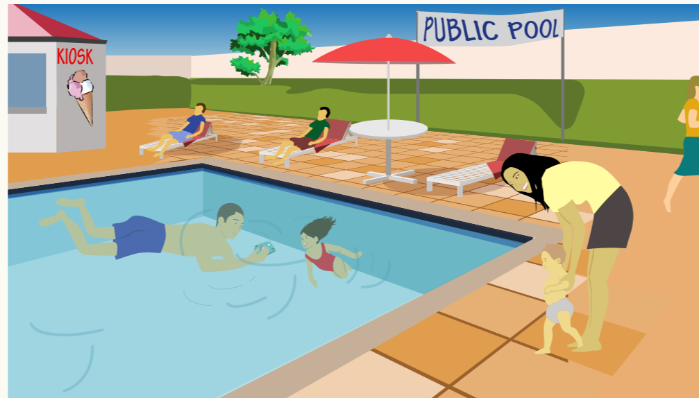
Të yöoc yin këñ, kek aci kek ya luuel bik kë yekë lëu kë ë luoi ya looi