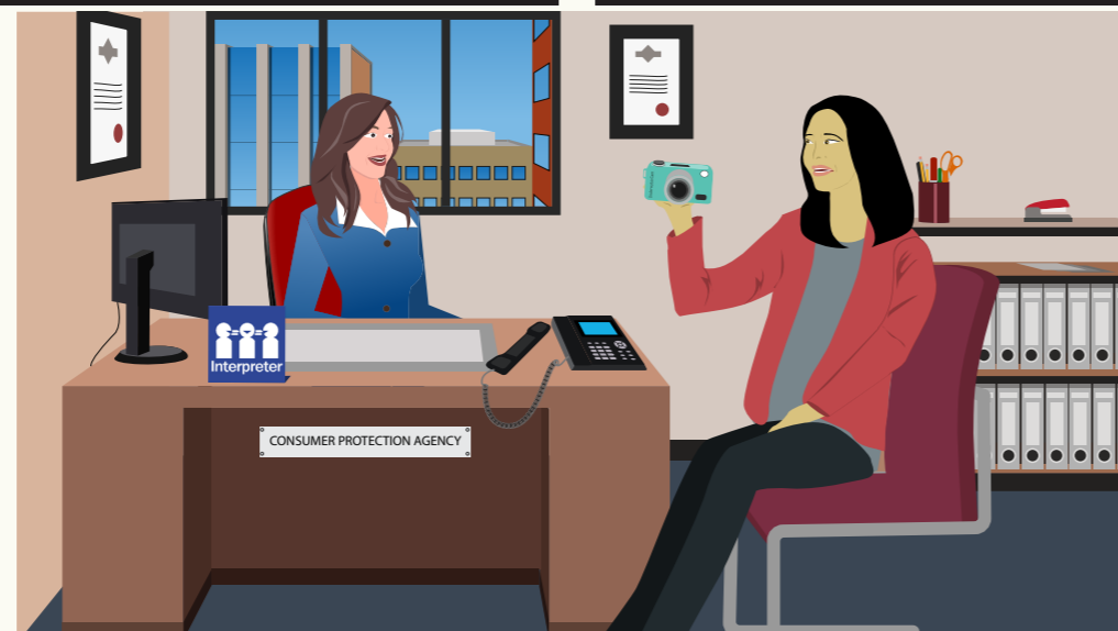
Consumer Protection Agency-du alëu bi yin kony bi këdun dhal yin kek matacjr/ raan ë këñ yaac ka raan ë këñ looi