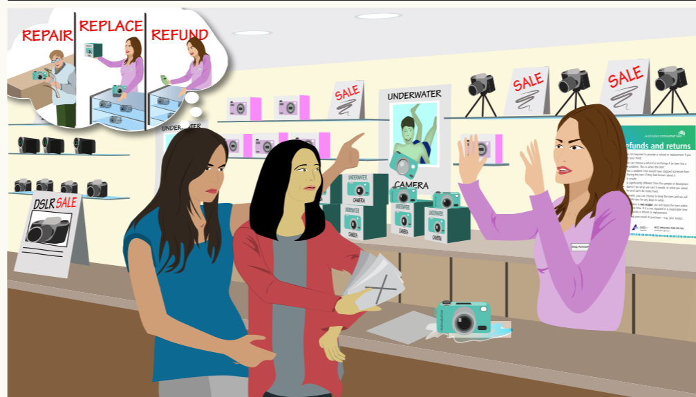
Na ye të DÏIT kë ci riäak ke yin alöc ye këno ba looi. Na ye të KOOR kë ci riäak ke raan ë këñ yaac/ matacjr yen alöc