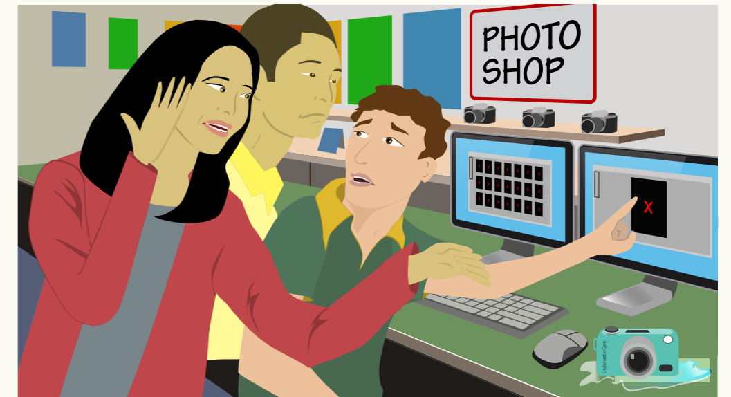
Na ye të nõñ yin kë cie puoth tëñë këñ ka kuõny , tuen them ba kuanyic kekë matacjr