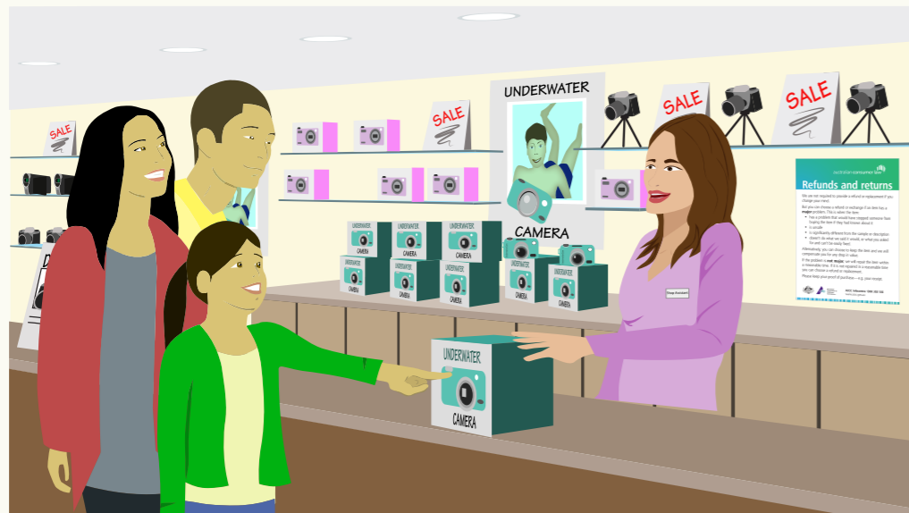
Në Australian Consumer Law koc ë yöoc aye nah yith ku kaken ye kek koor bik ya looi