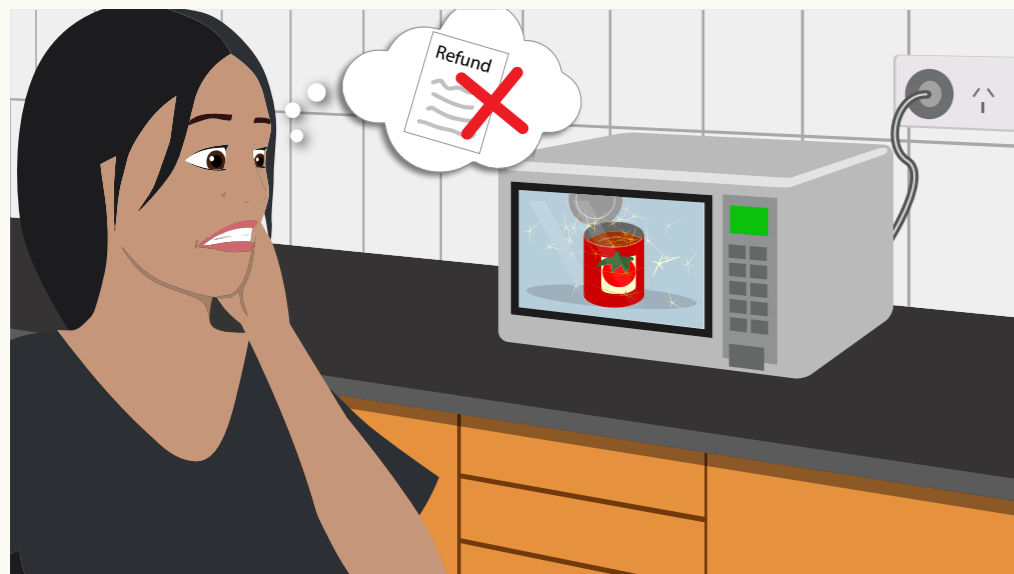
Na ye tē këñ yññ kë ca yōc nyiee looi apuuth, ke yññ AC'N DHUK ë WËU tēñë yññ.