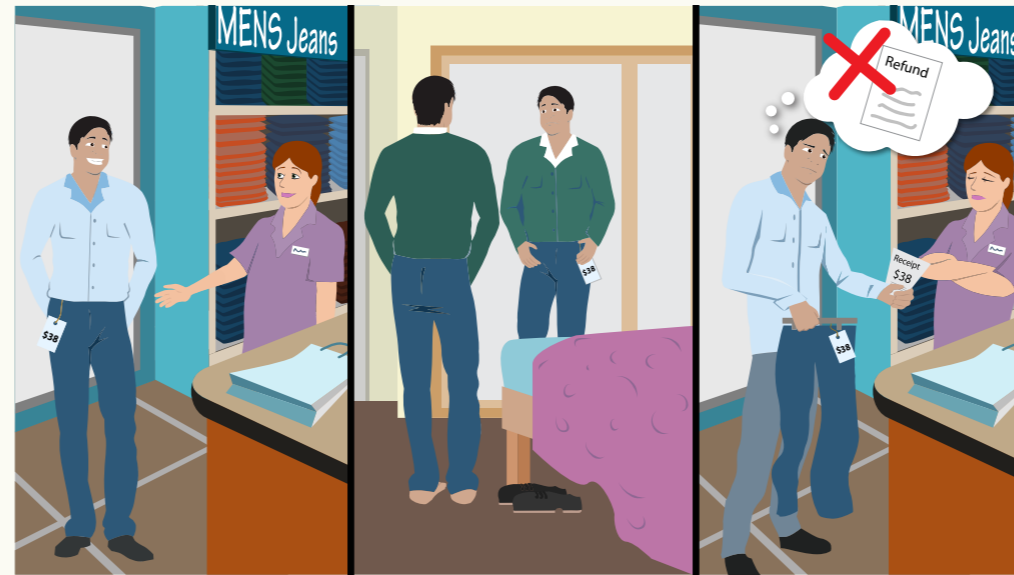
Na ye tē geer yññ yī nhom keyī cī thöl ë yōc, ke adukän ACIE gëm yññ WËU.