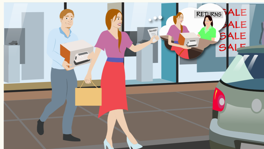
Në nyindhie ye muk nhom ba awërej c'ñ këñ yōc ya tōöu. Yen alëu ba dhil ë göör na noñ kë wäac.