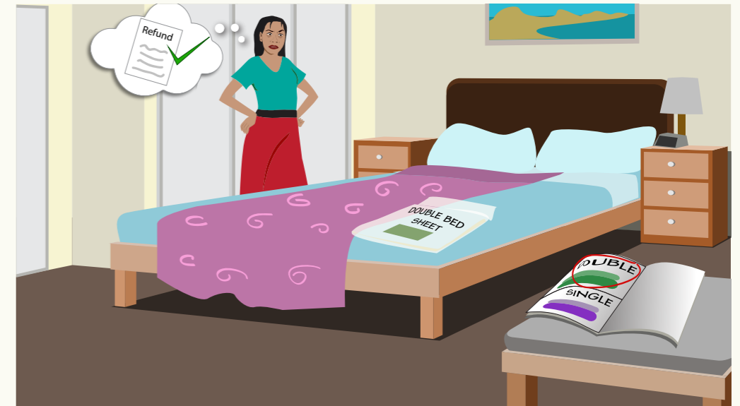
Na ye tē ka ca kek yōc wuöcc kekë kë cī gõt, ke yññ alëu bī yññ DHUK ë WËU